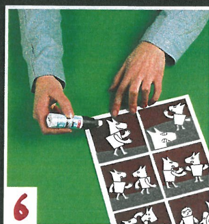
6 Plak nu de plaatjes in de volgorde van het draaiboek en niet veel later is je stripverhaal klaar!