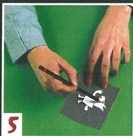
5 Omlijn de delen met een zwarte viltstift en teken zijn gezichtsuitdrukking.