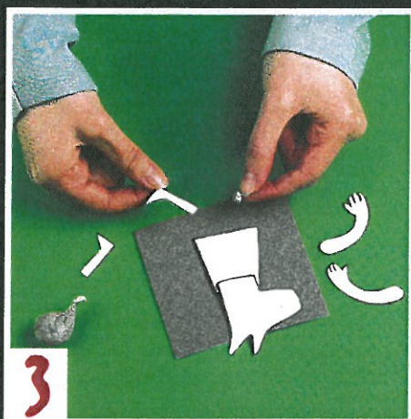
3 Stel je stripfiguurtje samen. In elk plaatje geef je hem een andere houding.