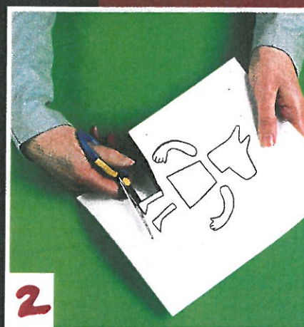
2 Knip de losse delen van de tekening uit en maak er verschillende fotokopieën van.