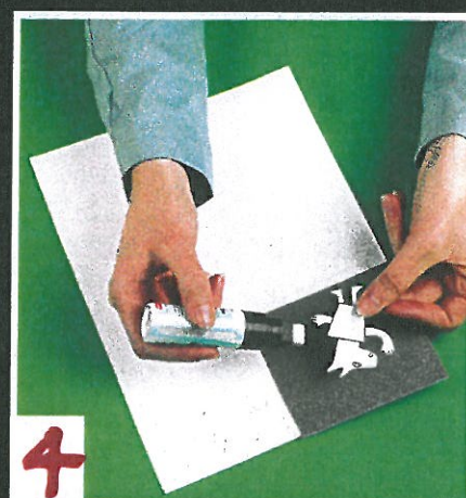
4 Plak het stripfiguurtje in het plaatje.